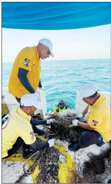
فريق الغوص يراقب حالة الشعاب المرجانية في «عريفجان»

البحرية للجهة الشرقية لموقع الشعاب بهدف استغلالها من رواد الموقع والقوارب واليخوت ولعدم رمي المراسي في قاع البحر. وأضاف الفاضل أن المشروع الثاني هو الرصد العلمي للحالة الصحية للشعاب المرجانية ورفع التقارير المستخلصة لمنظمة «كورال ووتش» في أستراليا التي تهدف إلى إشراك مجتمع الغواصين في العمل التطوعي لمراقبة الشعاب المرجانية بتسجيل مشاهداتهم وإرسالها ثم نشر نتائج هذه المشاهدات عالمياً لتزويد المختصين والباحثين بالمزيد من الدراسات والأبحاث. وذكر أن الفريق استطاع رفع شباك صيد مهمة عالقة بجانب الشعاب المرجانية في الموقع التي تسبب عادة دماراً للمرجان ونفوق الكائنات البحرية والأسماك، مبيناً أن الفريق يتعامل مع هذه الشبكات بحذر نظراً لخطورتها على الغواصين أثناء انقراضها من قاع البحر خصوصاً عند ارتفاع الموج أو اشتداد التيارات المائية.