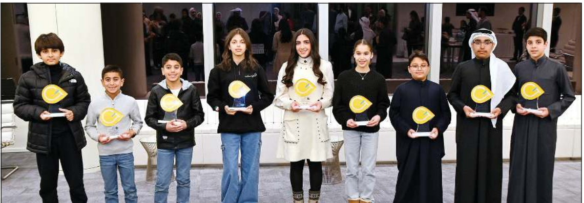
الجيل الثاني من برنامج جينيريشن ألفا