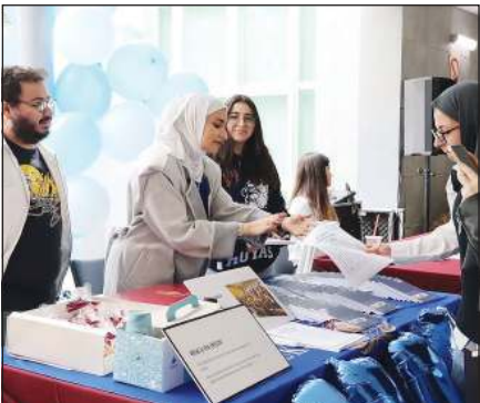
جانب من أسبوع الترحيب بالمستجدين