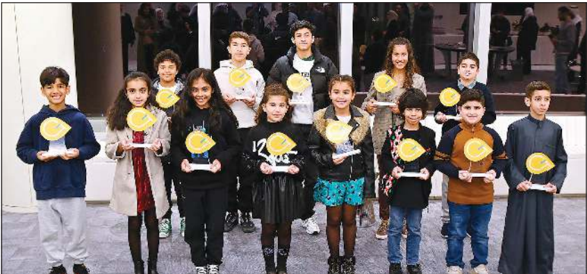
الجيل الثالث من برنامج جينيريشن ألفا

واجهوها إلى جانب مداخلات من عدد من أولياء الأمور والمدربين. وقد تزامن ذلك مع تنظيم شركة المشاريع لسلسلة من ورش العمل والبرامج التطويرية لتأهيل الرياضيين الصغار المشاركين في البرنامج.