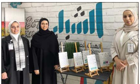
البرنامج يهدف إلى لتخريج قيادات مجتمعية من الشباب