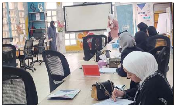
جانب من الجلسات النقاشية خلال البرنامج