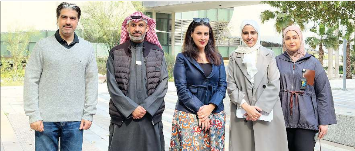
مسؤولو «زين» ومركز صباح الأحمد للموهبة والإبداع وقسم علوم الحاسوب بجامعة الكويت