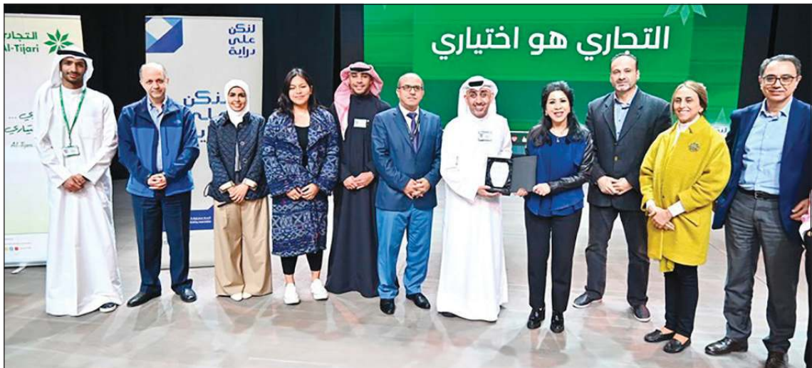
ممثلو الجامعة الأمريكية في الكويت مع فريق البنك التجاري

لحمايتهم من الهجمات المالية. والجامعة الأمريكية في الكويت أول جامعة خاصة للعلوم الإنسانية والآداب الحرة في الكويت وقد وضعت الجامعة معاييرها التربوية، والثقافية والإدارية بناء على النموذج التربوي المنبع في الجامعات والكليات في الولايات المتحدة الأميركية، وترتبط باتفاقية تفاهم وتعاون مع كلية دارتموث الأميركية وهي جامعة تربوية خاصة للتعليم العالي وتأسست في عام 1769.