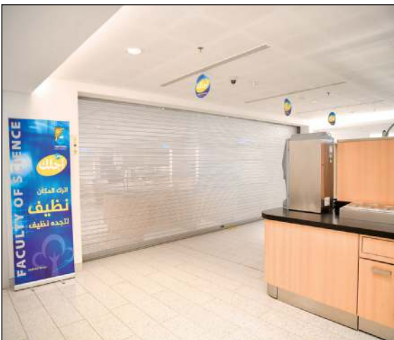
كافتيريا كلية العلوم مغلقة منذ أكثر من 6 أشهر

وأفاد بأن الطلبة يضطرون لتحمل عناء التعب للذهاب إلى كليات أخرى للشراء من الكافتيريا وهذا الأمر مجهد بالنسبة للطلاب خاصة حالياً مع ارتفاع حرارة الجو في فصل الصيف وأجواء الغبار والطقس غير المستقر بما يرهق الطلبة. وأشار إلى أن الكلية تفتقر إلى الخدمات الغذائية لعدم وجود أجهزة تغذية ناهيك عن غلق الكافتيريا ولا يوجد في الكلية سوى مطعم واحد فقط مستغرباً من فرض مطعم واحد على الطلبة، فهل يعقل أن يتناول الطلبة نفس الوجبة يومياً؟ وناشد العلاطي مدير جامعة الكويت د.يوسف الرومي، النظر في طلب طلبة وطالبات جامعة الكويت بإعادة افتتاح الكافتيريا.