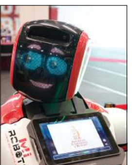
الروبوت DOT في المعرض الوظيفي

وراء العلم، وهذه الصفات تضمن النمو والتنمية المستدامين لمؤسساتكم». ثم تحدث ممثل K-net عن مشاركتهم في المعرض الوظيفي لهذا العام قائلاً: «تأتي مشاركة K-net تأكيداً على حرصها على دعم المواهب الشابة وإتاحة الفرص للخريجين الجدد في الجامعة الأمريكية في الكويت». وكان ضمن المشاركين بالمعرض الروبوت «DOT» وهو روبوت تفاعلي، إذ رحب بالشرائح المشاركة وتفاعل مع الطلاب والخريجين لتقديم معلومات حول الشركات وفرص التوظيف، ويأتي DOT ضمن تيم المعرض الوظيفي لهذا العام الذي يدور حول التحول الرقمي وكيفية الاستفادة من التطورات التكنولوجية في تبسيط العمليات وتوسيع نطاق الإبداع. وتفاعل الحضور مع الشركات، ومن بينها بنك برقان، حيث اكتسبوا فهماً أعمق لقطاع التوظيف، وأكد ممثل بنك برقان أن مشاركة البنك في المعرض الوظيفي بالجامعة الأمريكية في الكويت فرصة عظيمة للتواصل مع الخريجين