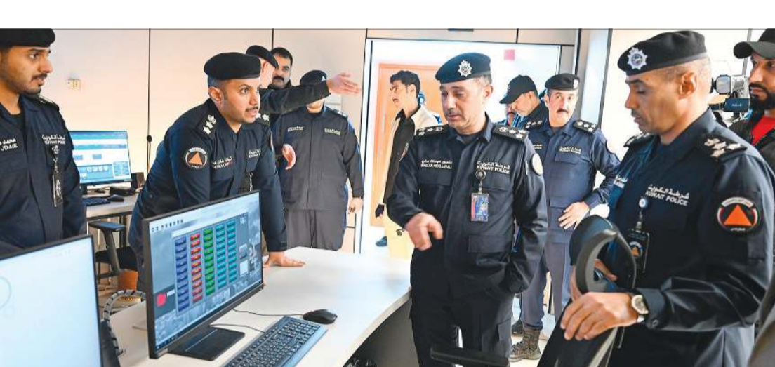
مدير عام الادارة العامة للدفاع المدني العميد منصور الحشاش (ريليش كومار)

عقد وكيل وزارة الداخلية اللواء عبدالوهاب الوهيب اجتماعاً مع رؤساء القطاعات المعنية المشاركة في التمرين التعاوني الخليجي المشترك «أمن الخليج العربي 4» الذي يقام في دولة قطر الشقيقة، في إطار التعاون ورفع الجاهزية وتعزيز التعاون الأمني. وخلال الاجتماع، نقل اللواء الوهيب إلى الحضور توجيهات النائب الأول لرئيس مجلس الوزراء ووزير الداخلية الشيخ فهد اليوسف بأهمية هذا التمرين في تعزيز التعاون الأمني الخليجي المشترك، ورفع مستوى التنسيق والتكامل الميداني بين الأجهزة الأمنية بدول مجلس التعاون لدول الخليج العربية. وأكد وكيل وزارة الداخلية على