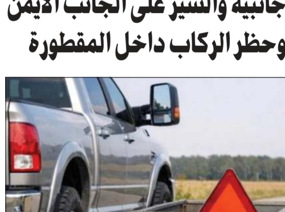
علامات تحذيرية لايد أن تتوافر في مركبات الجر