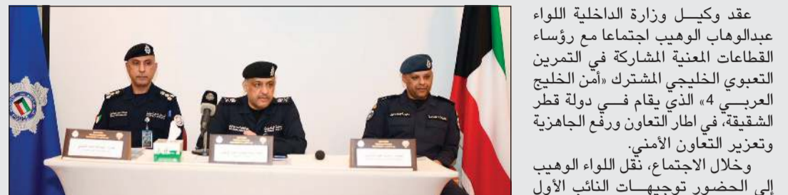
وكيل وزارة الداخلية اللواء عبدالوهاب الوهيب متوسلاً رئيس قطاع شؤون المرور والعمليات العميد عبدالله العتيقي ورئيس قطاع شؤون الأمن الخاص والمؤسسات الإصلاحية العميد دخيل العبد

عقد وكيل وزارة الداخلية اللواء عبدالوهاب الوهيب اجتماعاً مع رؤساء القطاعات المعنية المشاركة في التمرين التعاوني الخليجي المشترك «أمن الخليج العربي 4» الذي يقام في دولة قطر الشقيقة، في إطار التعاون ورفع الجاهزية وتعزيز التعاون الأمني. وخلال الاجتماع، نقل اللواء الوهيب إلى الحضور توجيهات النائب الأول لرئيس مجلس الوزراء ووزير الداخلية الشيخ فهد اليوسف بأهمية هذا التمرين في تعزيز التعاون الأمني الخليجي المشترك، ورفع مستوى التنسيق والتكامل الميداني بين الأجهزة الأمنية بدول مجلس التعاون لدول الخليج العربية. وأكد وكيل وزارة الداخلية على