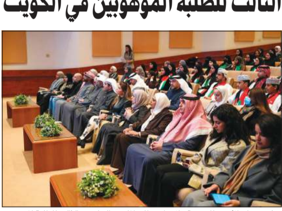
مركز صباح الأحمد للموهبة والإبداع يطلق الملتقى الخليجي الثالث للطلبة المهويين

كونا: انطلقت أمس الإثنين أعمال الملتقى الخليجي الثالث للطلبة المهويين بتخليد من مركز صباح الأحمد للموهبة والإبداع أحد مراكز مؤسسة الكويت للتقدم العلمي تحت شعار «غذاء أمن.. مستقبل واعد معا نحو أمن غذائي مستدام في دول الخليج». تستضيفه دولة الكويت خلال الفترة من 18 إلى 22 يناير الحالي أن تنظيم الملتقى في نسخته الثالثة يعكس التزام الكويت بالقضايا الاستراتيجية. وأكد في ختام تصريحه أن الهيئة العامة للتعليم التطبيقي والتدريب