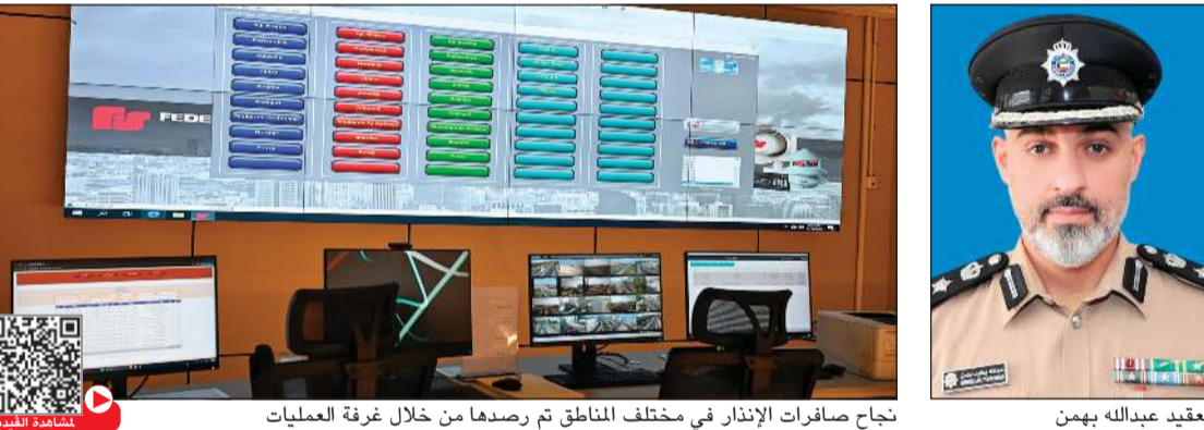
تجاش صافرات الإنذار في مختلف المناطق تم رصدنا من خلال غرفة العمليات