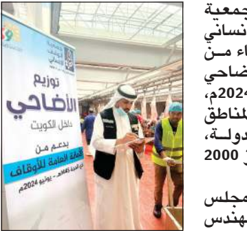
جانب من توزيع الأضاحي

أعلنت الجمعية الخيرية للأضاحي وتنفيذ مشروع الأضاحي للعام 1445هـ - 2024، داخل الكويت وبالمناطق الفقيرة في 14 دولة، بعدد أضاح تجاوز 2000 أضحية.