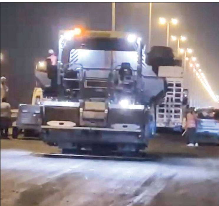
جانب من أعمال صيانة الطرق