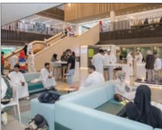
من أحد اللقاءات التنويرية

اختتمت الجامعة الأمريكية الدولية (AIU) برنامج اللقاء التنويري للطلاب الجدد (NSO)، والذي عقد في 2 و3 و7 سبتمبر الجاري، وسط أجواء مليئة بالحماس والطاقة، معلناً بداية رحلة أكاديمية جديدة لطلابها الجدد.