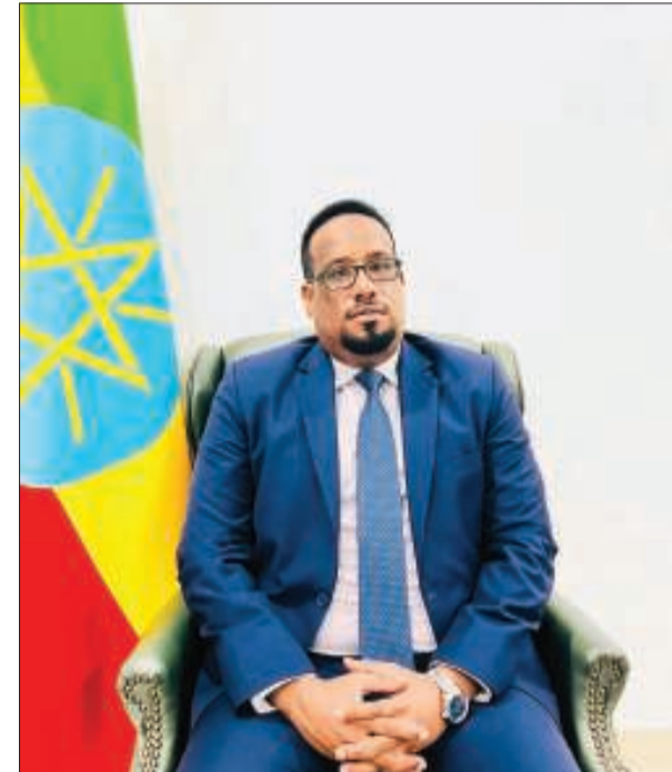
السفير سعيد جبريل