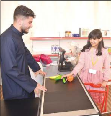
تعليم طالبة أسس الشراء والتسوق