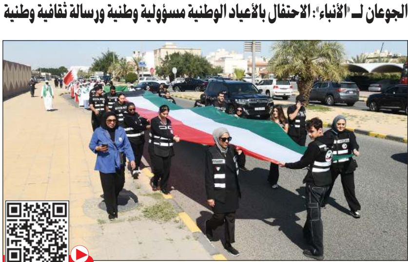
مسيرة بالعلم الكويتي للمشاركين في مهرجان السلام السابع (متين غوزال)