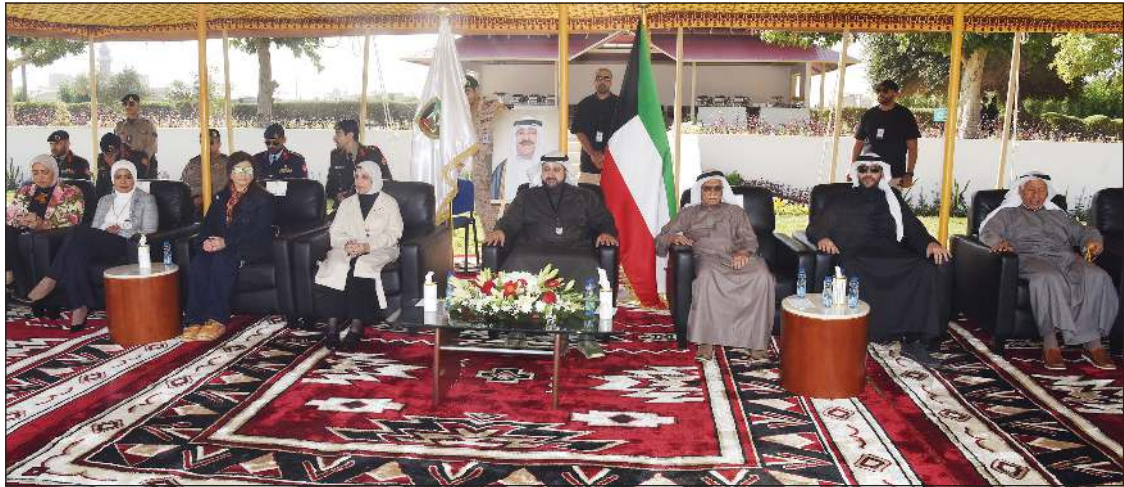
الحضور خلال حفل «هندسة المنشآت العسكرية» (أحمد علي)