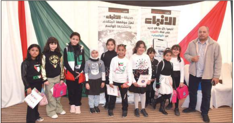
صورة تذكارية لطلبات المرحلة الابتدائية في جناح «الأنباء» (أحمد علي)