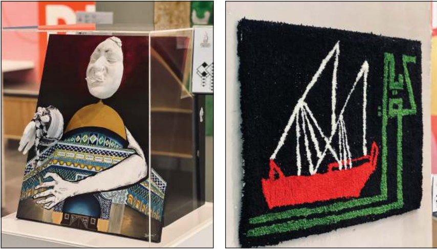
من الأعمال الطلابية جانب من مشاريع الطلبة

خلال هذه الدورات، يكتسب الطلبة رؤى مختلفة تساعدهم على تعزيز فهمهم للحاضر والماضي في منطقتنا العربية. والجامعة الأمريكية أول جامعة خاصة للعلوم الإنسانية والآداب الحرة في الكويت. وقد وضعت الجامعة معاييرها التربوية، والثقافية والإدارية المتبع في الجامعات والكليات في الولايات المتحدة الأميركية وترتبط باتفاقية تفاهم وتعاون مع كلية دارتموث الأميركية وهي جامعة تربوية خاصة للتعليم العالي وتأسست عام 1769.