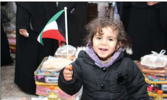
حفظ لله الكويت من كل سوء