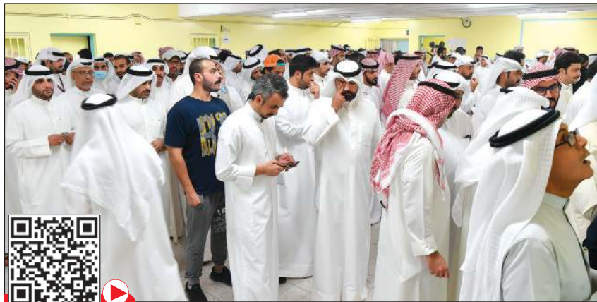
حشود كبيرة في انتخابات جمعية الأندلس