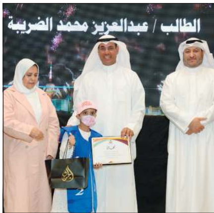
تكريم أحد الطلبة