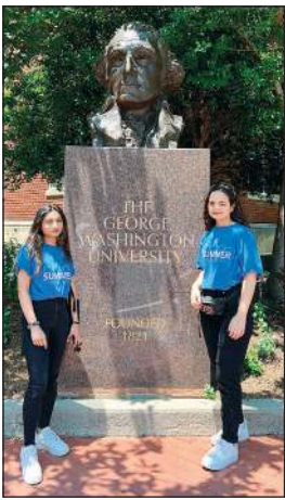
طلبة «AUK» في جامعة جورج واشنطن

توجه 6 طلبة من الجامعة الأمريكية في الكويت (AUK) إلى كلية دارتموث في هامبشير بالولايات المتحدة ضمن برنامج التدريب الطلابي، كما تم إيفاد طالبين للدراسة في جامعة جورج واشنطن.