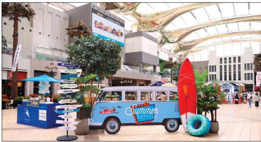
أجواء الصيف في معرض الأفيونز الصيفي

خارج الكويت. وأعربت إدارة الأفيونز عن سعادتها بالتفاعل المستمر من قبل الزوار مع المعرض، مؤكدة حرصها على أن يقضي كل الزائرين أمتع الأوقات خلال تواجدهم في الأفيونز. لافتة إلى أنها تقوم دائماً بتنظيم الأنشطة والفعاليات على مدار العام.