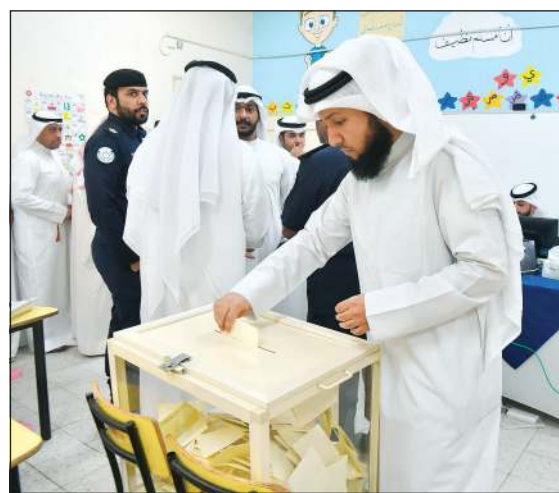
مواطن يبدلي بصوته

والتنمية المجتمعية أحمد فريج العنزي على الجهود الكبيرة التي بذلها العقيد الرشود ورفيقه لتسهيل عملية الاقتراع وتنظيمها بالشكل اللائق.