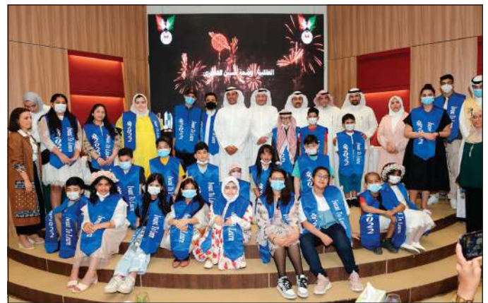
صورة جماعية للمشاركين في الحفل

بهذا التكريم الذي أكد على دعم مجموعة الجري القابضة للفعاليات المجتمعية المختلفة ومنها جمعية «أبي أتعلم» التي الجري بتكريم الطلبة والطالبات فئات المجتمع ومنهم فئة أبنائنا المرضى الذين نحرص على تلقيهم كل الدعم لإكمال مسيرتهم التعليمية، مبيحة أن جهودهم وتفوقهم الدراسي على الرغم من الظروف الصحية الصعبة التي مروا بها خلال مراحل الدراسة.