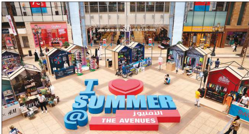
جانب من معرض الأفيونز الصيفي