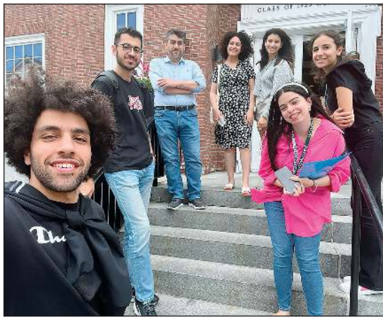
جانب من الطلبة المتدربين في كلية دارتموث