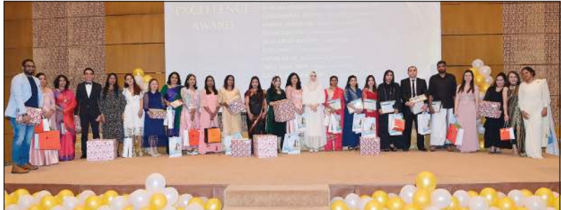
جانب من المشاركين في الاحتفال