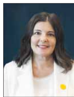
الدكتورة أسيل العوضي

أعلن مجلس الأمناء بالجامعة الأميركية في الكويت بقيادة الشبيخة ادانا ناصر الصباح عن تعيين الدكتورة أسيل العوضي رئيساً للجامعة، في خطوة تعكس مسار التطوير المؤسسي والنمو الأكاديمي. ويؤكد اختيار العوضي التزام الجامعة في استكمال مسيرة التميز في مجالات التعليم والبحث العلمي وخدمة المجتمع لما تتمتع به من خبرة أكاديمية وقيادية واسعة حيث كُرست مسيرتها المهنية لخدمة التعليم العالي والتربية. وعلى امتداد مسيرتها، أظهرت الدكتورة أسيل التزاماً راسخاً في تطوير العملية التعليمية والارتقاء بجودة التعليم وتمكين الشباب من