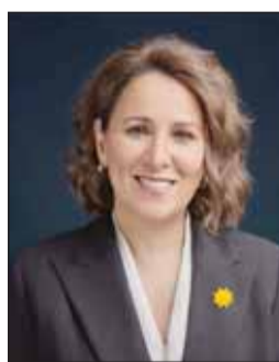
الشيخة ادانا ناصر صباح الأحمد

خلال التنمية الفكرية والإسهام الفاعل في المجتمع، ويصفتها رئيساً للجامعة، تواصل الدكتور أسيل العوضي مسيرة التميز وتعزيز مكانة الجامعة كأحد المؤسسات الرائدة في التعليم العالي في الكويت والمنطقة وذلك من خلال تطوير البرامج الأكاديمية ودعم كفاءة أعضاء هيئة التدريس وتوسيع نطاق الشراكات الاستراتيجية والارتقاء بمخرجات التعليم والبيئة الأكاديمية. وأرعبت أسرة الجامعة الأميركية في الكويت عن ترحيبها بالدكتورة العوضي متطلعة إلى ما ستقدمه قيادتها من رؤى استراتيجية وجهود أكاديمية تسهم في تعزيز مسيرة الجامعة والارتقاء بمستوى التميز وترسيخ مكانتها كمؤسسة رائدة في محليا ودوليا.